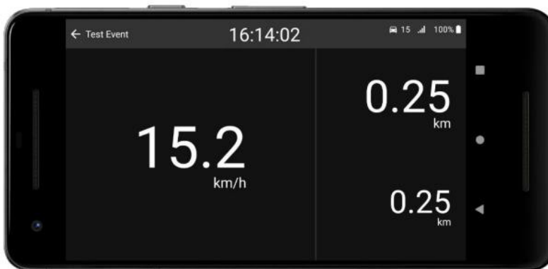
Main Screen off stage when tracking.

Klicken Sie auf „start tracking“ sobald Sie mit der Besichtigung beginnen.