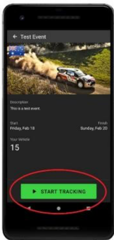
Click start tracking when beginning recce.

When logged into the event with your code, the main screen will display your current speed and two odometers. Both odometers can be reset by pressing and holding the mileage.