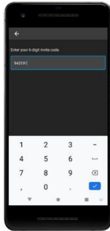
Enter unique code.

Hauptbildschirm wenn die App geöffnet wird. Klicken Sie auf „Add event.“