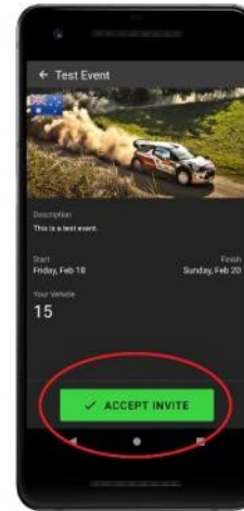
Click accept invite.