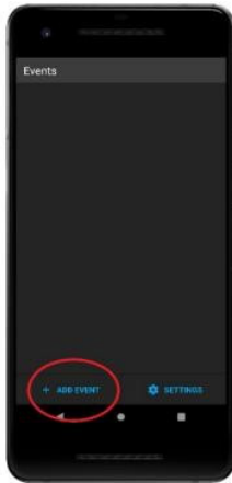
Main Screen when app is opened. Click "add event".

Hauptbildschirm wenn die App geöffnet wird. Klicken Sie auf „Add event.“